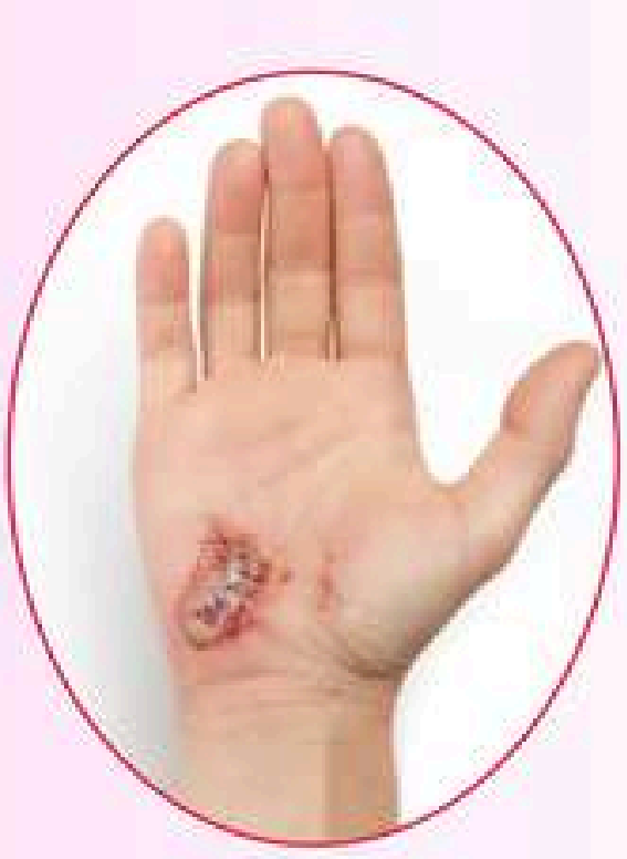
घाउ ढिलो सन्चो हुने