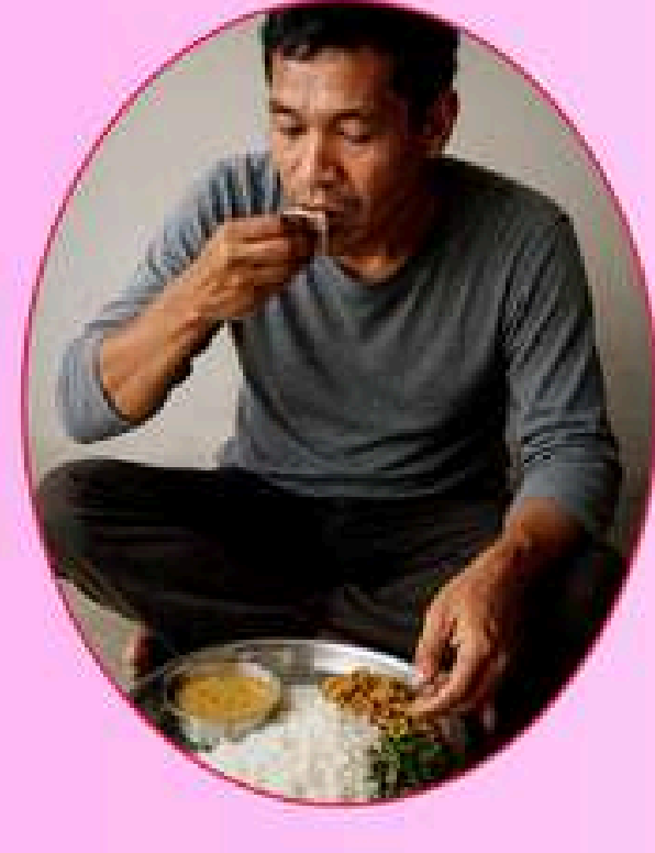
भोक धेरै लाग्ने