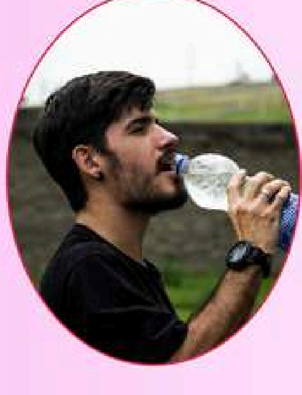
प्यास धेरै लाग्ने