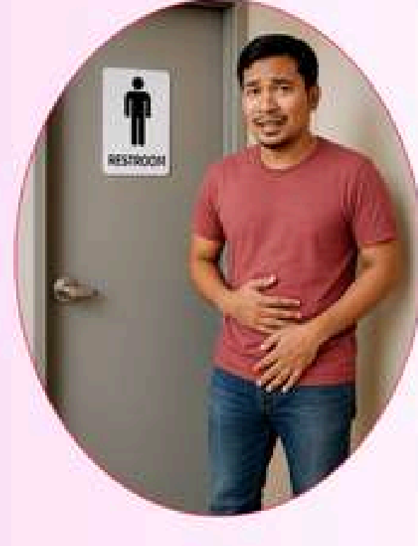
पिसाब धेरै लाग्ने